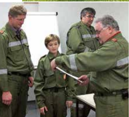
Ehrgeiz und Leistung müssen natürlich auch anerkannt werden.