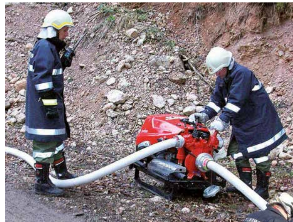
Laufende technische Neuerungen auf dem Gebiet der Ausrüstung erfordern permanente Schulungen