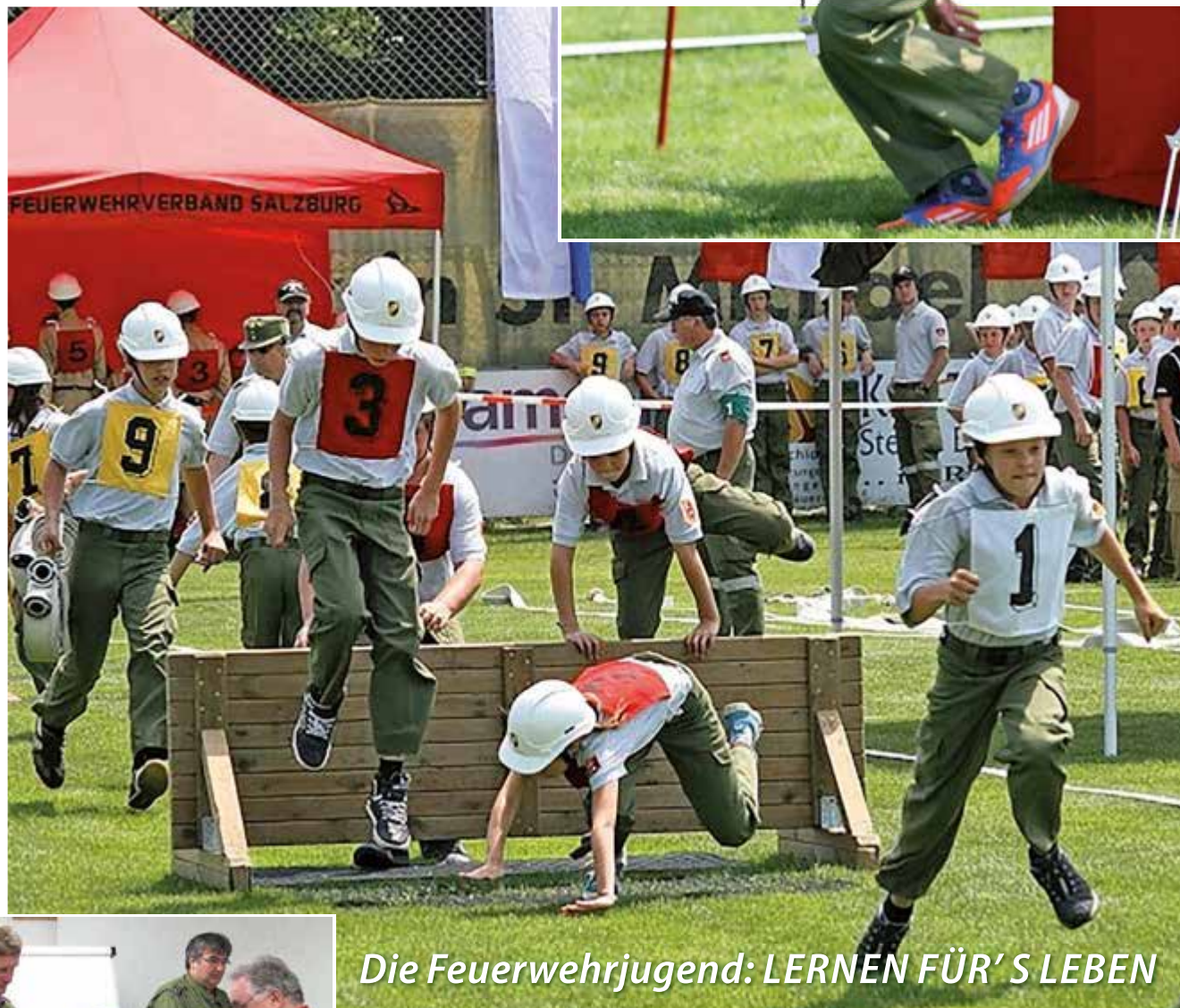
Die Feuerwehrjugend: LERNEN FÜR'S LEBEN