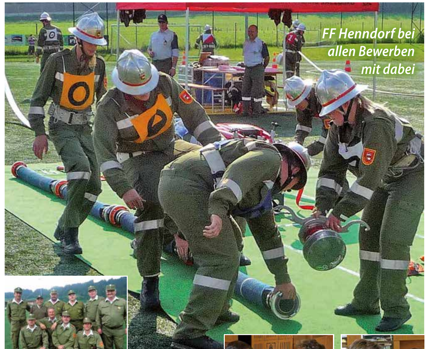
FF Henndorf bei allen Wettbewerben mit dabei

Über sehr guten Zuspruch in der Feuerwehrjugend darf man sich weiterhin bei der Feuerwehr Henndorf freuen: Nicht weniger als 22 Mitglieder zählt die Gruppe momentan. Diese gelungene Mischung aus Spiel, praktischen Übungen, Kameradschaft und Zusammenhalt in der Gruppe bildet nicht nur eine sinnvolle Freizeitbeschäftigung, sondern auch die Gelegenheit, sich für das spätere Leben gewisse Fähigkeiten, aber auch Charaktereigenschaften anzueignen. Beim Wissenstest der Flachgauer Feuerwehrjugend in Strobl Anfang April 2013 traten zehn Henndorfer Jugendliche mit Erfolg an und beim Salzburger Jugend-Landesbewerb in St. Michael im Lungau im Juli 2013 schafften nicht weniger als 15 Henndorfer Jugendliche die Leistungsabzeichen in den verschiedenen Kategorien. Schließlich kann beim „Tag der Flachgauer Feuerwehrjugend“ in Seekirchen im August 2013 beim Bewerb um den „Erich-Antonitsch-Wanderpokal“ der 5. Platz erreicht werden. Aber auch im Henndorfer Feuerwehrgeschehen abseits von Tests und Wettbewerben mischt die Feuerwehrjugend aktiv mit: So sind die Jugendlichen beim jährlichen „Gemeinsamen Samstagdienst“, einer Reinigungsaktion im Feuerwehrhaus, voll eingeteilt, und auch beim Pfingstkirtag in „Breiing“ gibt es vielfältige Aufgaben für die Feuerwehrjugend.