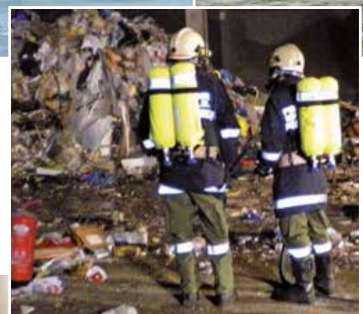
Brand bei der Firma Reststofftechnik.