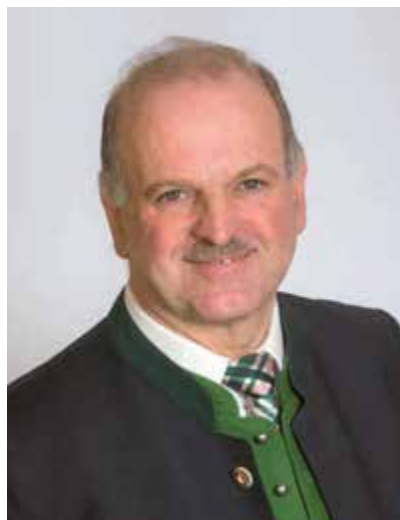
Bürgermeister RUPERT EDER