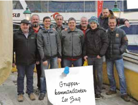
Gruppenkommandanten 2er Zug