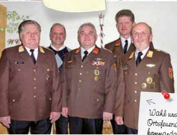
Wahl unseres Ortsfeuerwehrkommandanten